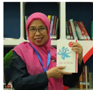
ASIH RAWANIS BAHASA INDONESIA