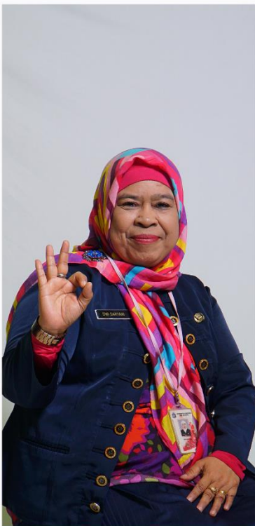
DWI DARYANI BIMBINGAN KONSELING