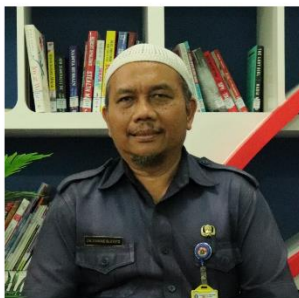
DWI RAHMAD SUJIYOTO SENI RUPA