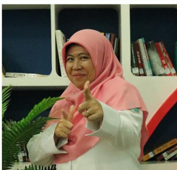
EKA BARKAH KIMIA