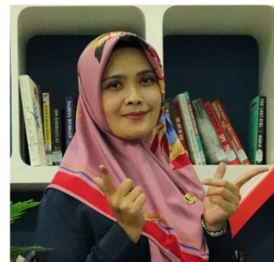
LALA ISUM MATEMATIKA