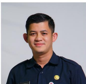
SUMARDIANSYAH P.K. SEJARAH