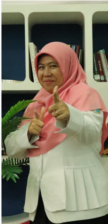
EKA BARKAH KIMIA