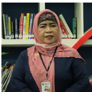
SETYANINGSIH SUSIOWATI BAHASA INDONESIA