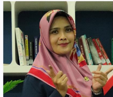
LALA ISUM MATEMATIKA