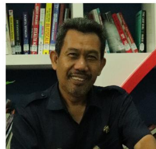
ADE NURYAMAN SEJARAH