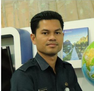
TUBAGUS BAY HAQI BAHASA INGGRIS