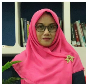
ANI TRI HARTANTI MATEMATIKA