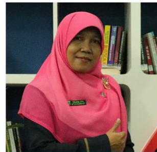
TRILIANA BAHASA INDONESIA