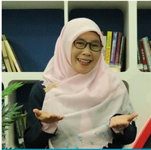
SITI AISYAH AGAMA ISLAM