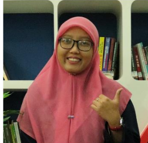
PUTRI DWI JAYANTI BAHASA INGGRIS