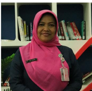
IDA USAMANTI BAHASA INDONESIA