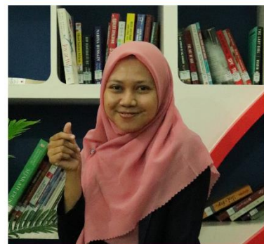
RIA TRI LESTARI BIOLOGI